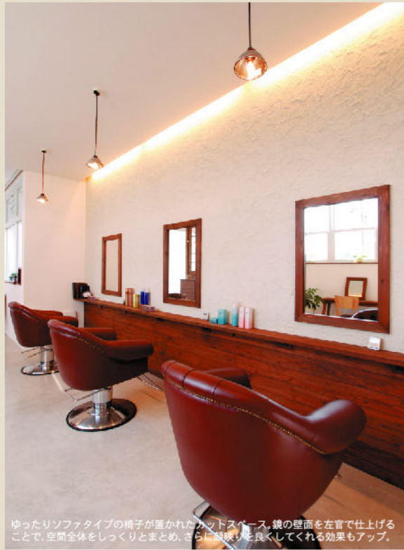
ゆったりソファタイプの椅子が置かれたカットスペース。鏡の壁面を左官で仕上げることで、空間全体をしっとりまとめ、さらに暖かみも良くしてくれる効果もアップ。