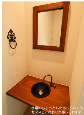
水場のちょっとしたあしらいにもセンスとこだわりが感じられます。