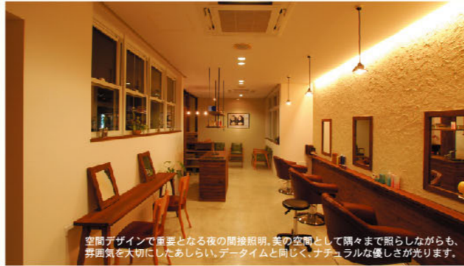
空間デザインで重要となる夜の間接照明。柔らかな光として隅々まで照らしながらも、雰囲気大切にしたい。データイムと同じく、ナチュラルな優しさが光ります。