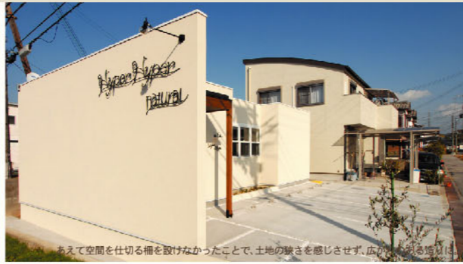
あえて空間を仕切る柵を設けなかったことで、土地の狭さを感じさせず、広がりを感じる。