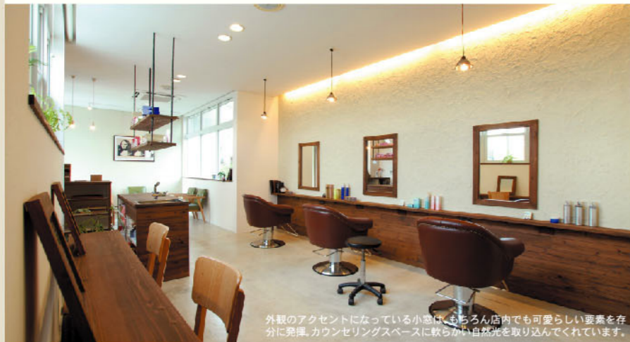
外観のアクセントになっている小窓は、もちろん店内でも可愛い要素を十分に発揮。カウンセリングスペースに柔らかい自然光を取り込んでくれています。