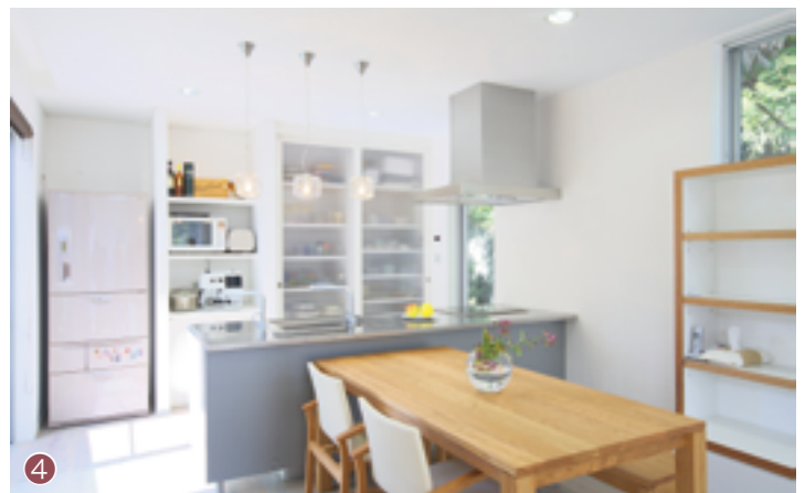
④ テラスにつながり、外への開口部もある開放感いっぱいのキッチン。リビングを見ながら調理や家事をこなせるアイランドタイプ。

では、Oさん家族と建築家・中道氏との出会いはというと…それは城善建設が運営するASJ（アーキテクト・スタジオ・ジャパン）和歌山スタジオの完成見学会。ASJとは、