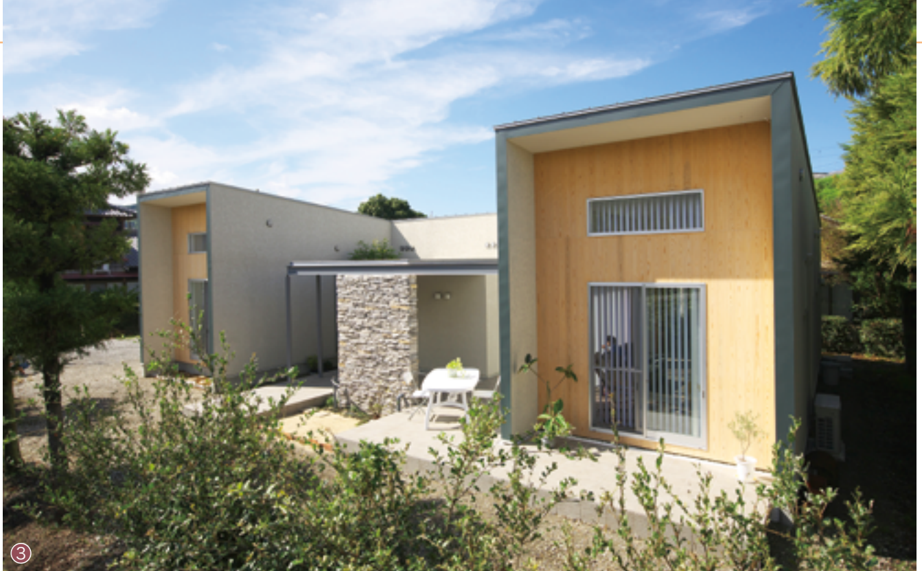
③ 広い敷地の中、自然と調和するモダンな平屋建て。大きな庇を石のブロックで支えるエントランス設計が家全体のアクセントに。