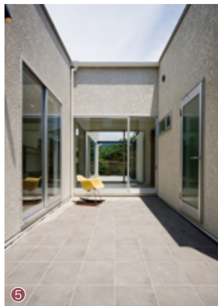
⑤ 第2のリビングともいえる大きなテラスはグレーのタイルを敷いてシックに。室内とのスムーズな動線がポイント。

熊野古道沿いの小高い丘、眼下には富田川、周囲は山々という恵まれたロケーション。ご主人は釣りやサーフィンをされるアウトドア派、奥さんはソムリエをめざしてイタリアで勉強されたこともある、絵の好きなインドア派。そんな二人の嗜好に合わせた個性いっぱいのO邸。知